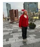
赤い帽子に赤い服

三宮街頭掃除に参加するようになって早いもので1年を過ぎました。今では月一度の街頭掃除がすっかり楽しみのひとつになりました。 街頭掃除の日でなくても今では掃除が日課となっています。日常の中でふとイライラしたり、不安に苛まれたり、いろんな心情的な波が起こります。 その波に流されるままになっていたら、どんどんとイライラは募り不安も膨らんでいきます。 そんな中、心の安定剤として掃除が一番早く簡単な方法になることに気づきました。ゴミを拾う、机を磨く、どんな些細なことも良いです。 行動が即座に結果として現れます。自分の動きがわずかではあるけれど社会の役に立っている。その実感が自信になり、不安も消えていきます。 ゴミを「捨てる」より「拾う」人でありたい。その小さな行動(決断)の積み重ねが心身を清く保ち、良い縁を結び合わせていくのだと信じています。