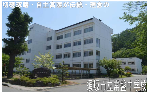
須坂市立常盤中学校