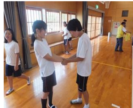
しっかりと握手して解散。