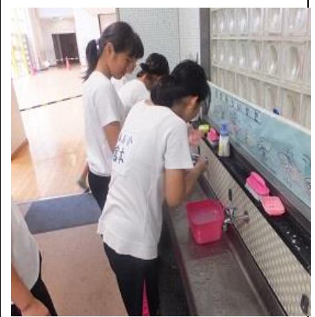
終了後、手をきれいに洗います。