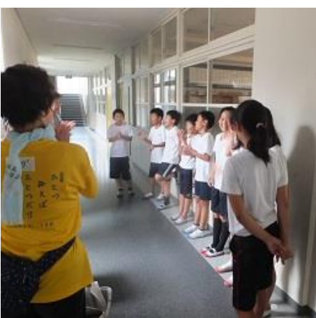
トイレ前でのチーム終礼。