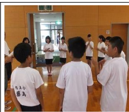
自己紹介と掃除の思いの発表。