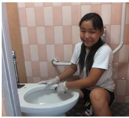
トイレ掃除の開始です。