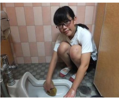
トイレがピカピカになりました。