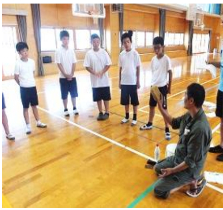
道具説明に皆真剣なまなざし。