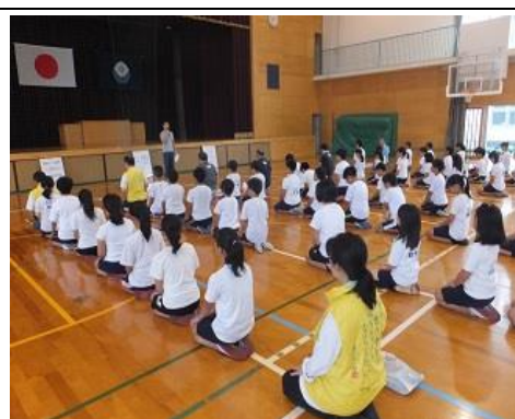
立腰。皆の背筋がまっすぐに。