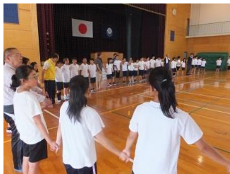
全員で手を繋ぎ「故郷」を合唱。