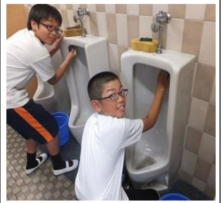
僕がきれいに掃除します！