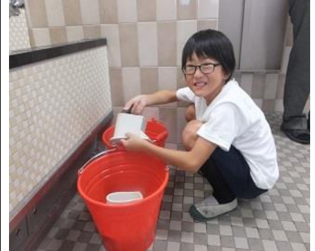
水こしを掃除しています。