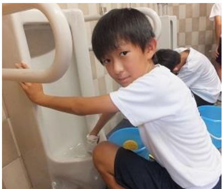
よし、汚れが落ちたぞ！