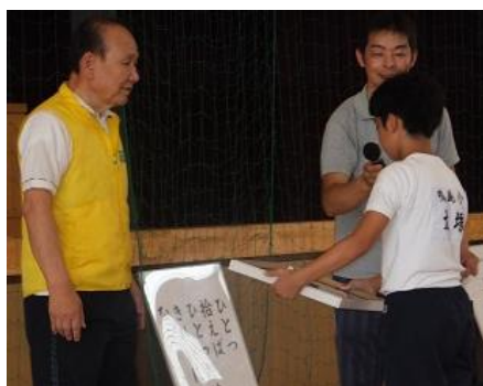
学校へ記念品を贈呈。