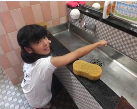
洗面台をピカピカに。