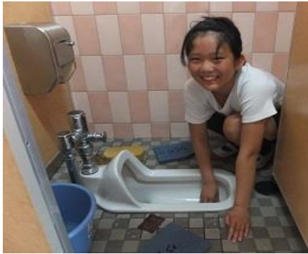
だんだん汚れが落ちてきました。