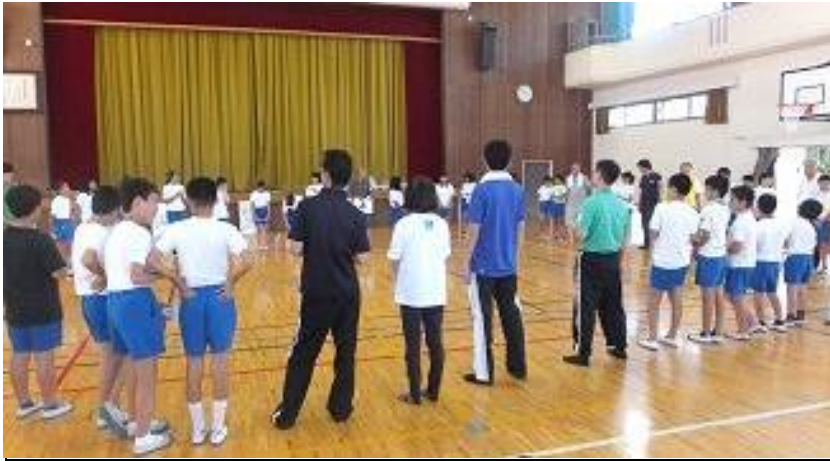
全員一つの輪になり故郷の合唱です。