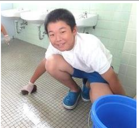
床をきれいに掃除しています。