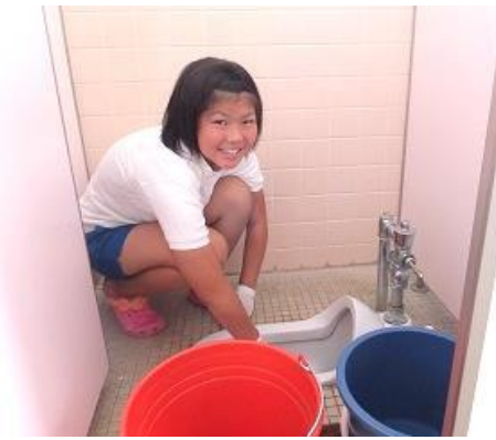
いよいよお掃除の開始です。