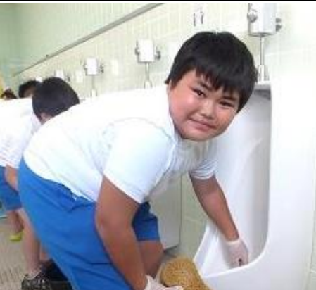
きれいになるまで頑張るぞ！