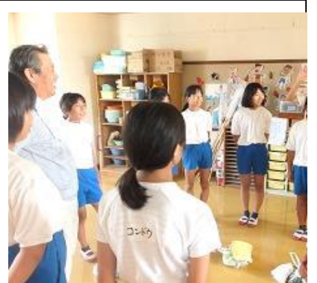
トイレ前での終礼です。