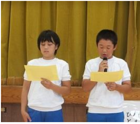
「ひとつ拾えば」の読み上げです。