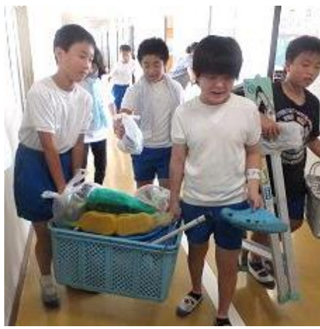
皆が分担し道具を運びます。