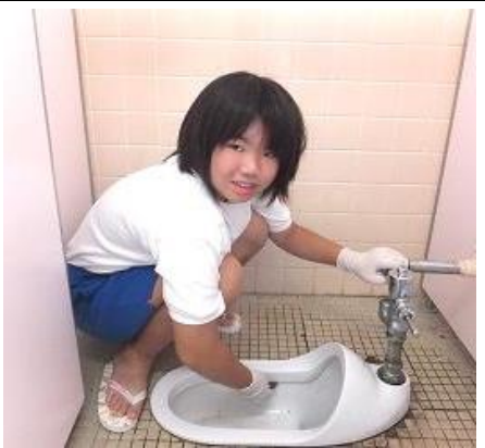
ピカピカになってきました。