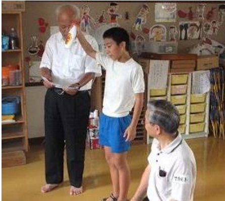
生徒さんサブリーダーの道具説明です。