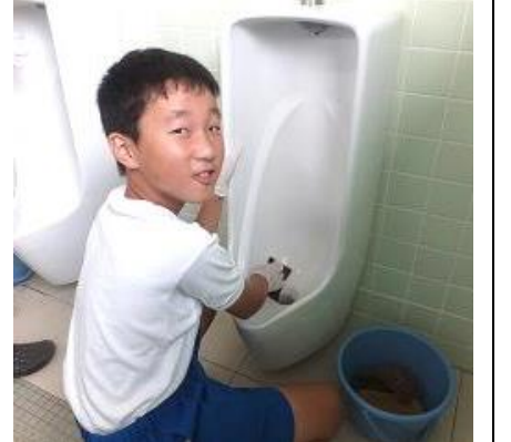
便器をしっかり磨いています。