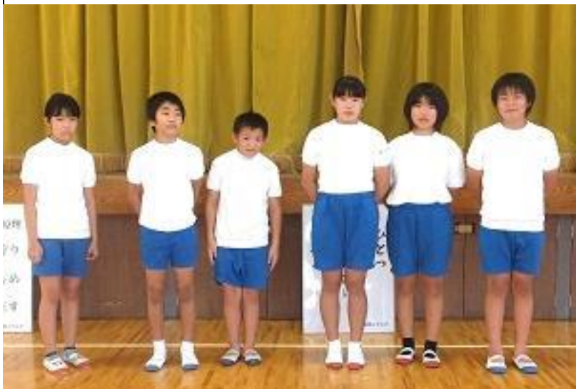
各班を代表し発表された生徒さん