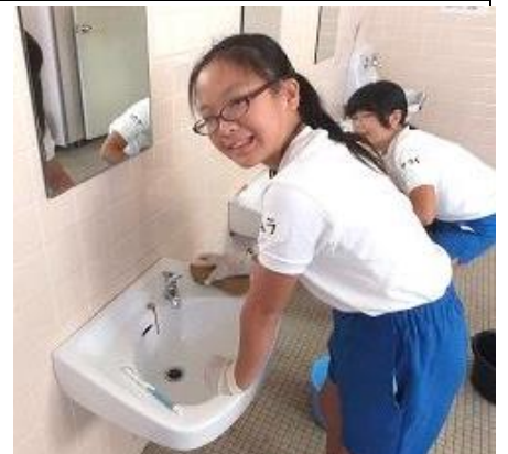
洗面台もピカピカにしています。