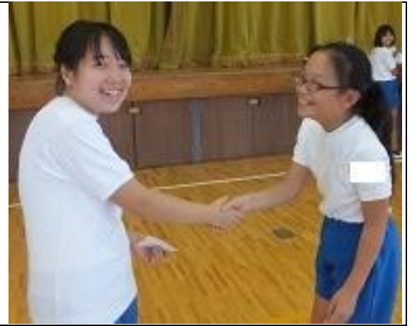
周りの人5人と握手して解散。