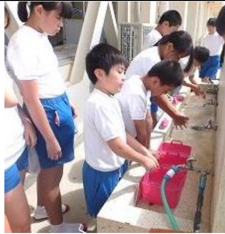
しっかりと手洗いをしています。