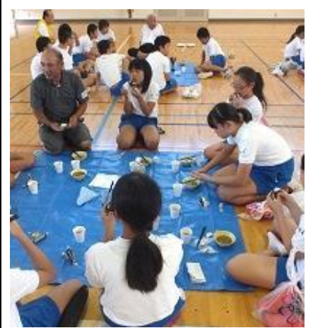
軽食の時間。豚汁がおいしい。