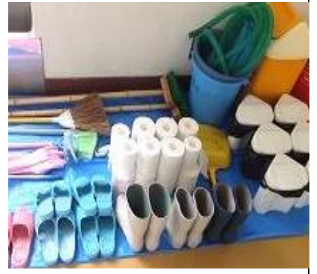
学校の道具を綺麗に並べました。