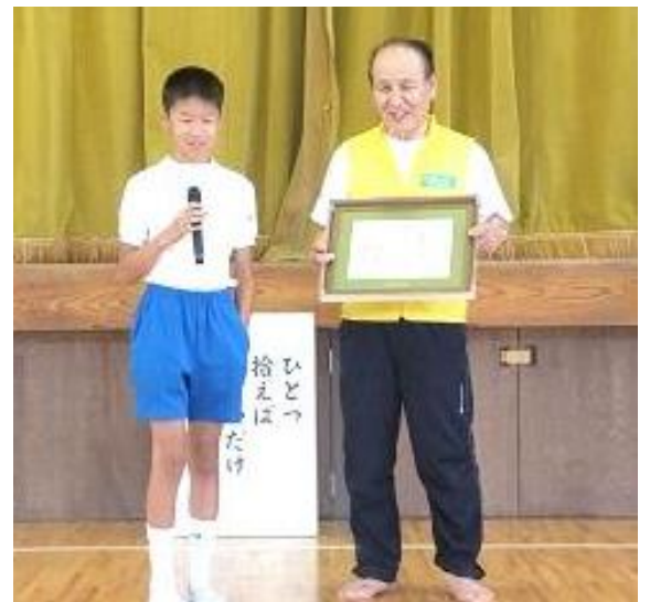
徳島掃除に学ぶ会より板東小学校様へ記念品の贈呈です。