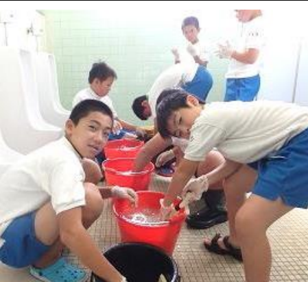
みんなで掃除道具を洗っています。