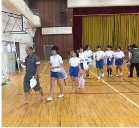
各班トイレに向かい出発。