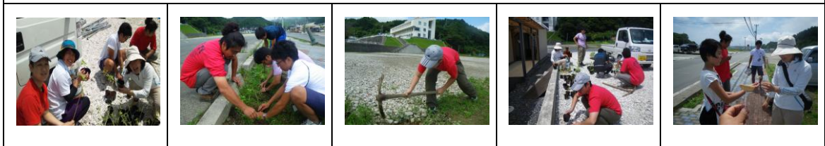
仮設の周りを掃除。現地の方とさせてもらい会話がはずみました。