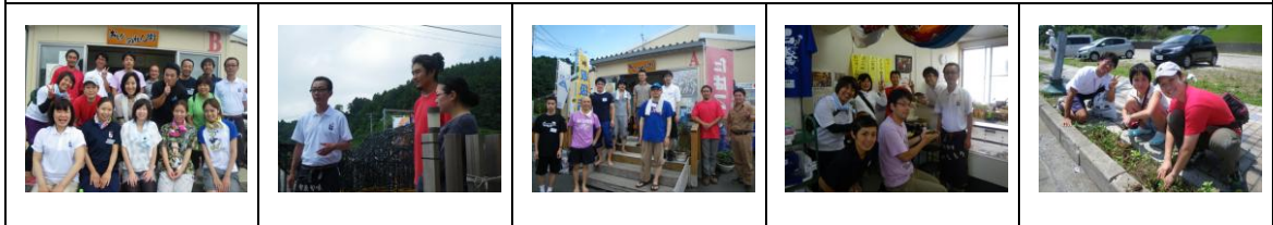
仮設商店街の方と記念撮影にお話をさせていただきました。