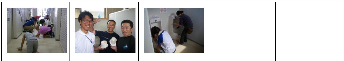
仮設のトイレ掃除。尿こしもピカピカ☆