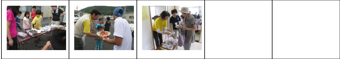
たくさんの方に来ていただき、あっという間の完売でした。