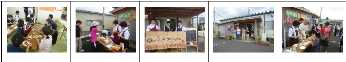
夏祭りを盛り上げる手作り屋台。たこやき*ミルクせんべい*スイカ割りなど。。