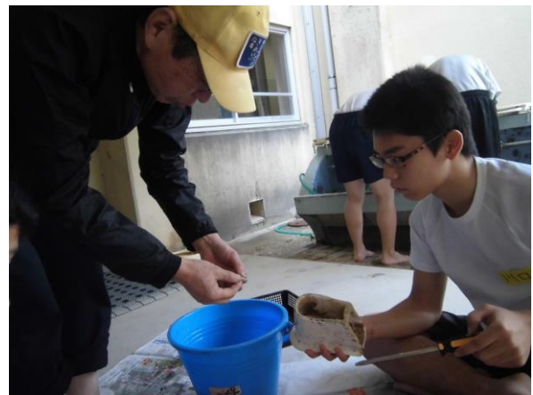
尿こしの掃除 秘儀を伝授されています

今回は時間が少なく、最後まですることが出来ませんでした。次回、便教会がある際には、最後までていねいに出来るよう、頑張りたいと思います。また、