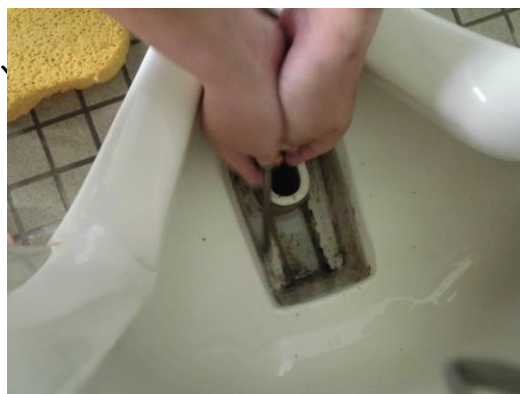
なかなか見ない角度です

今回はじめて参加しました。DVDを見たとき、便器の中に素手をつっこんでまで本格的に掃除しているのを初めて見ました。なので、私もそんな掃除をできるように頑張りました。私が掃除をしているところは、換気扇の真下で、ほこりやさびがたくさん落ちてきてたいへんだったけど、その汚れがきれいに落ちると、気持ちよくて、家の