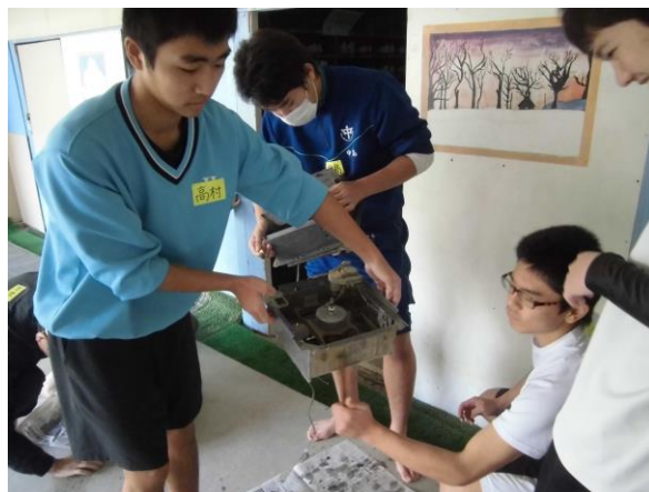
換気扇も解体して掃除

「トイレ掃除」と聞いて、良いイメージがわく人は少ないと思います。実際、私もその1人でした。だけど、何でもやってみることが大事なんだなぁと改めて思い、感じる事ができました。はじめに「掃除の道」のVTRを見たとき、インタビューを受けていた人たちが笑顔でした。やっぱりきれいになったトイレを見ると、自然と笑みがこぼれるし、自分たちがキレイにしたいと思うと、うれしくてたまらなかったです。家に帰って、まずトイレ掃除をやって、特に「サッシ(ドアのレール)」をキレイにします！！