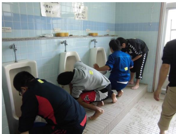
便器との距離が自然と縮まります

掃除をして、こんなにも心がきれいになると言うことを直接肌で感じられたことは、とてもいい経験になりました。今回、自分は便器を担当しなかったんですけど、自分の家でも素手でトイレ掃除を試みようと思いました！！今回はとても貴重な体験をさせてくださってありがとうございました。