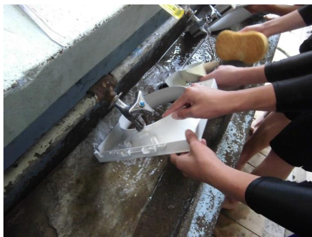
換気扇もピカピカ！

異性（女性）のトイレだったけど、きれいにしたから心もすっきりした。日々の掃除からあんなに1人1人が頑張ったら、西中はもっとよくなると思う。それを変えていくのは今日参加した自分たちだと思う。次参加する人が増えたらうれしいなと思います。