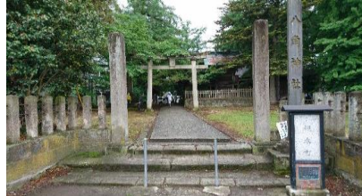
お八角様 槻木町側(北側)