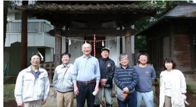
酒造組合のみなさん