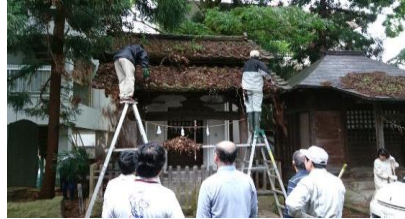
屋根の上まで掃除