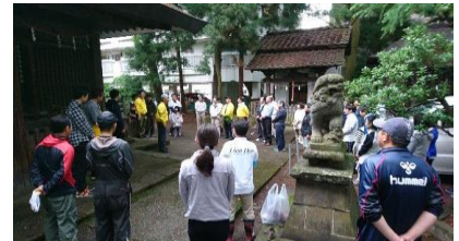
目黒議長のうん蓄に聞き入る参加者