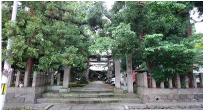
お八角様 鳥居町側(南側)