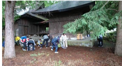
八角神社の裏まで