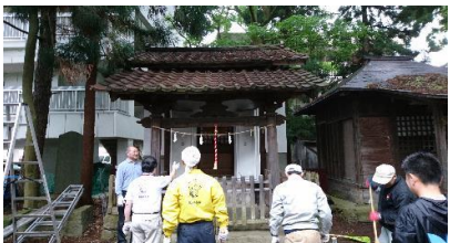
みるみるきれいになる様にみんな感動