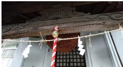
酒林、鈴、鈴緒も新調