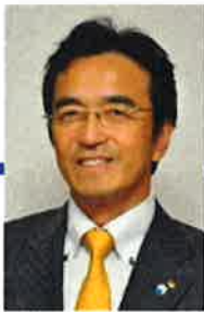
大会実行委員長 ごあいさつ