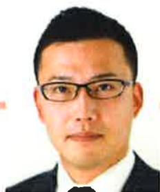
大会実行委員長 ごあいさつ