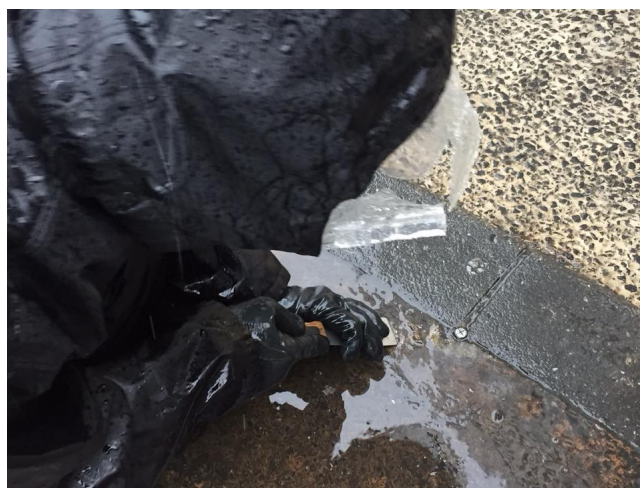
第 9 回の様子