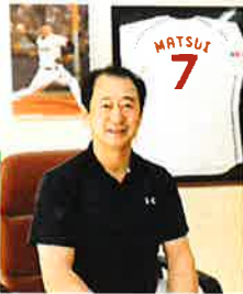
大会実行委員長 ごあいさつ