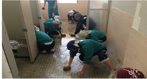
ジャージの裾をまくってお掃除する生徒さんも